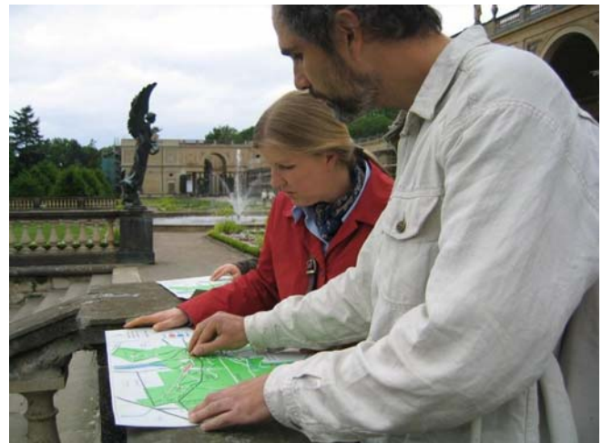
links: Tastmodelle im Slawendorf Brandenburg, rechts: Tastplan vom Park Sanssouci in Potsdam